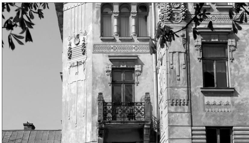
Майолікові декори на фасаді будинку «Дністер»