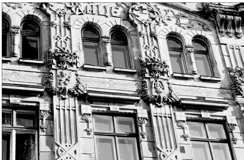
Історична геральдика на фасаді з боку вул. Руської