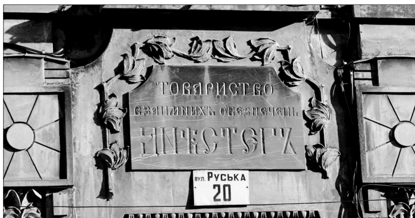
Таблиця над порталом головного входу