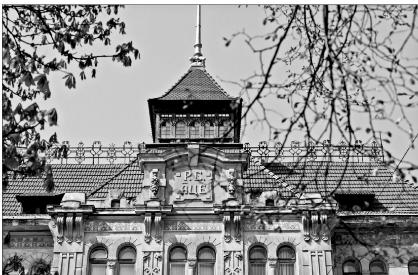
Аттик із написом «Р. Б. АЦЕ» – Року Божого 1905 (рік початку будівництва)