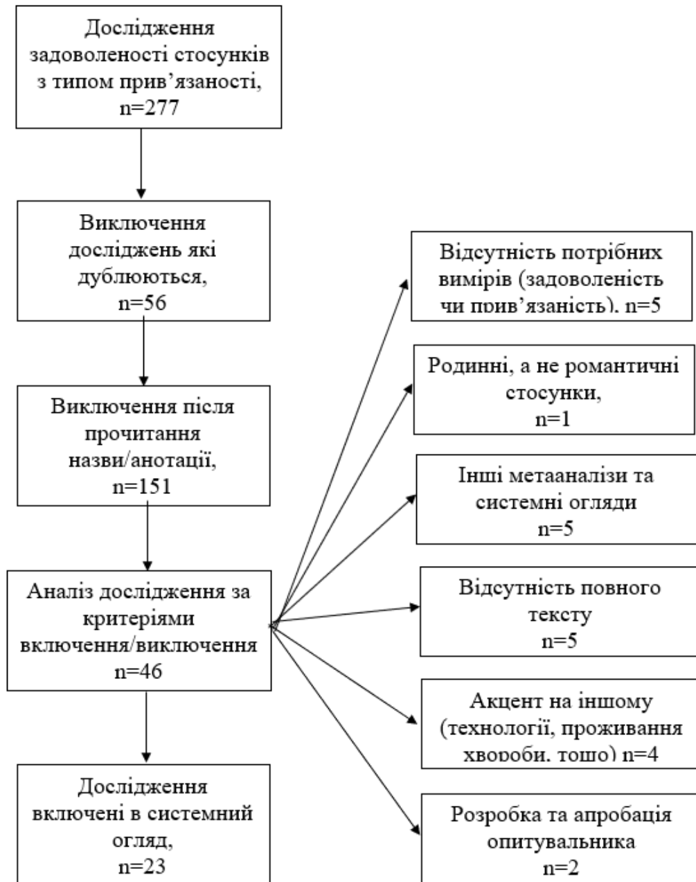
Рис. 2.1 Процедура відбору досліджень