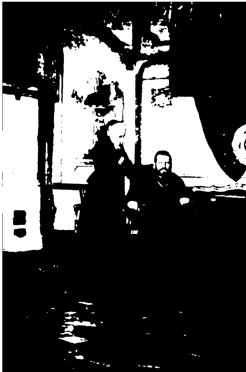
Софія Фредро-Шептицька і митрополит Андрей Шептицький