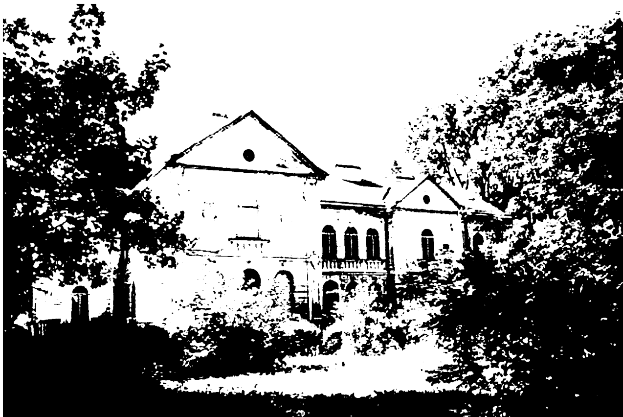
Музей родини Фредро в Беньковій Вишні