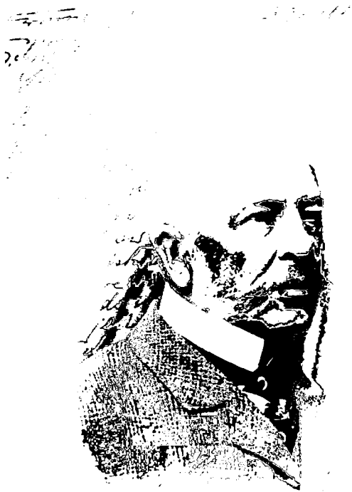
Ян Кантій граф Шептицький.