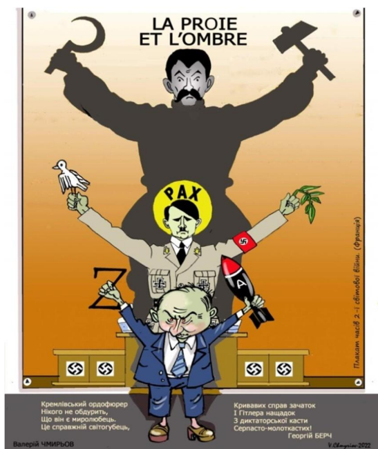
Рис. 3. Чмирьов В. La Proie et l'Ombre. Перець. 2022. № 7. С. 1

листівки, випущеної близько 1939–1940 р. Це карикатура невідомого автора під назвою «Хижак і його тінь» («La Proie et l'Ombre»), яка, ймовірно, була рефлексією на підписання пакту Ріббентропа – Молотова.