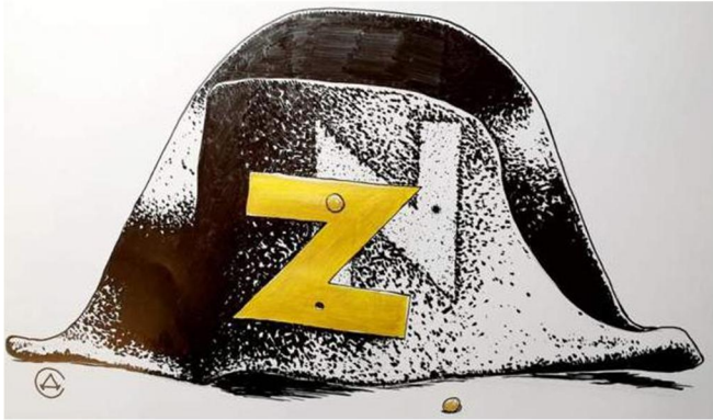
Рис. 6. Клімов А. Без назви. Перець. 2022. № 9. С. 4

Внутрішній сенс карикатури – в отождненні не лише символів, планів, а й долі Наполеона і путіна. Читача у такий спосіб підводять до логічного висновку, що як і Наполеон, який свого часу завоював значну частину Європи, спіткнувся на Росії і зазнав краху, путін неминуче програє війну з Україною.