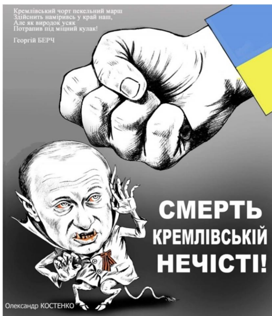
Рис. 2. Костенко О. Смерть кремлівській нечисті! Перець. 2022. № 5. С. 1

Титульна сторінка одного з березневих номерів має назву «Смерть кремлівській нечисті!» (рис. 2). На цей час вже стало зрозуміло, що задуманий москвою блицкриг провалився, окупанти почали зазнавати невдач, а Збройним Силам України вдається перехоплювати ініціативу на багатьох напрямках. Хоча автор малюнка Олександр Костенко (Костенко, 2022) зображає путіна у вигляді Сатани, однак останній вже добряче отримав кулаком, що визирає із жовто-блакитного рукава. Образ путіна-Сатани виглядає зловісно, в стилі усталеної ще з середньовічних часів іконографії. Хоча домінантні для образу роги на голові відсутні, однак ми бачимо всі інші атрибути: оголені ноги з роздвоєними копитами, хвіст, звірячі вуха, крила кажана за плечима, кігті на руках, лиса голова, закривавлена пащека з гострими іклами, зловісні, запліли кров'ю очі (Link, 1995:35-80).