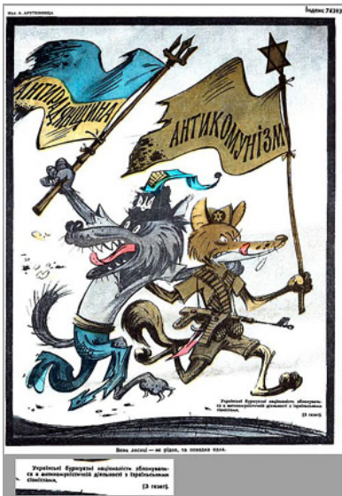
Додаток № 5 Радянська пропагандистська антисіоністська та антиукраїнська карикатура 186