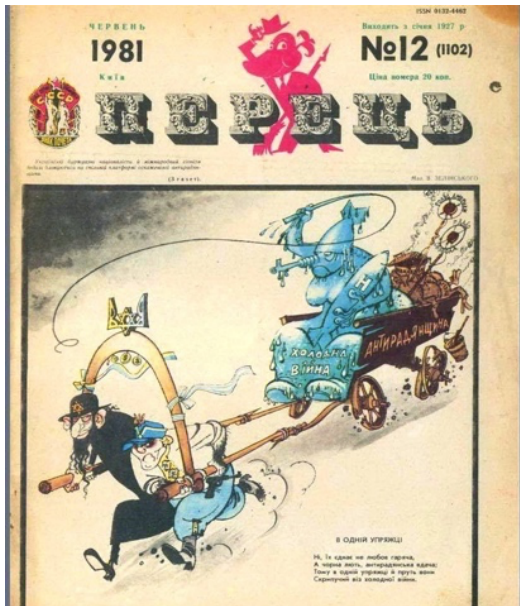
Додаток № 3 Радянська пропагандистська антисіоністська та антиукраїнська карикатура 184