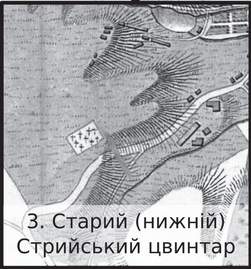
3. Старий (нижній) Стрийський цвинтар