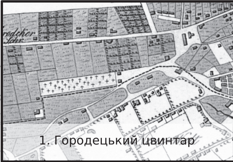
1. Городецький цвинтар