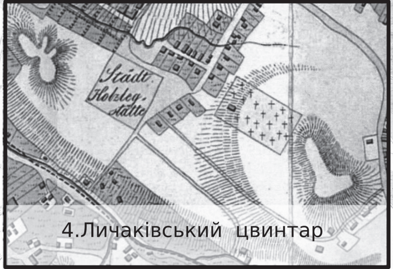
4. Личаківський цвинтар