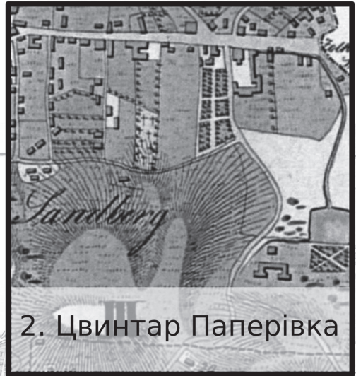
2. Цвинтар Паперівка