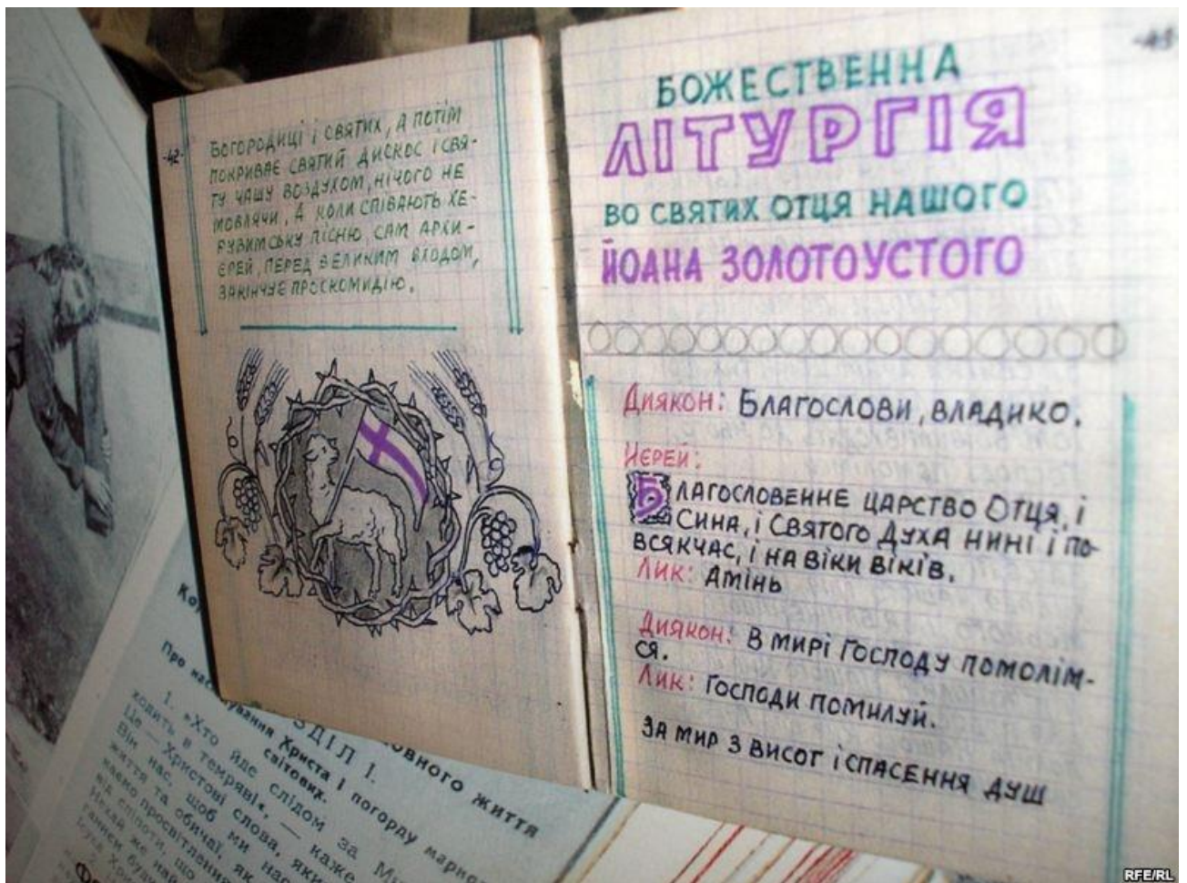
Службник під час підпілля. 269