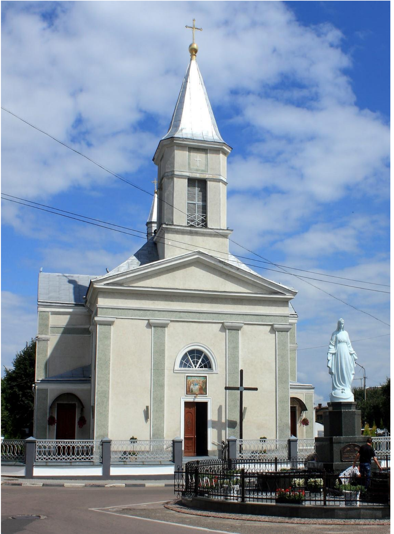
Катедральний храм Успіння Пресвятої Богородиці (сучасний вигляд)