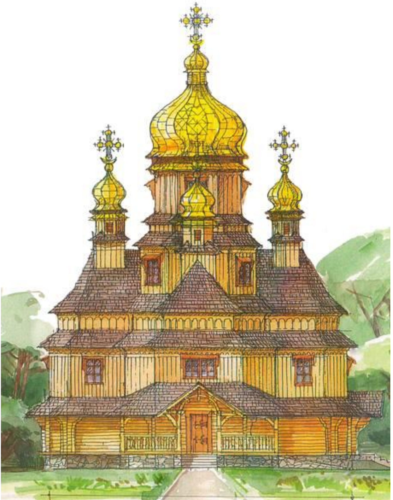
Проект дерев'яного храму Блаженного священномученика Миколая Чарнецького