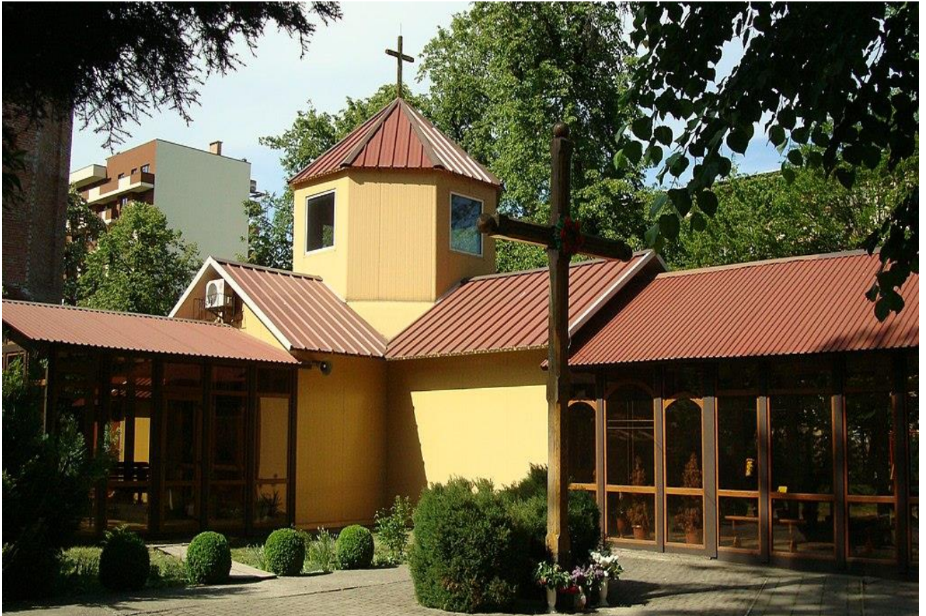
Каплиця св. Якова