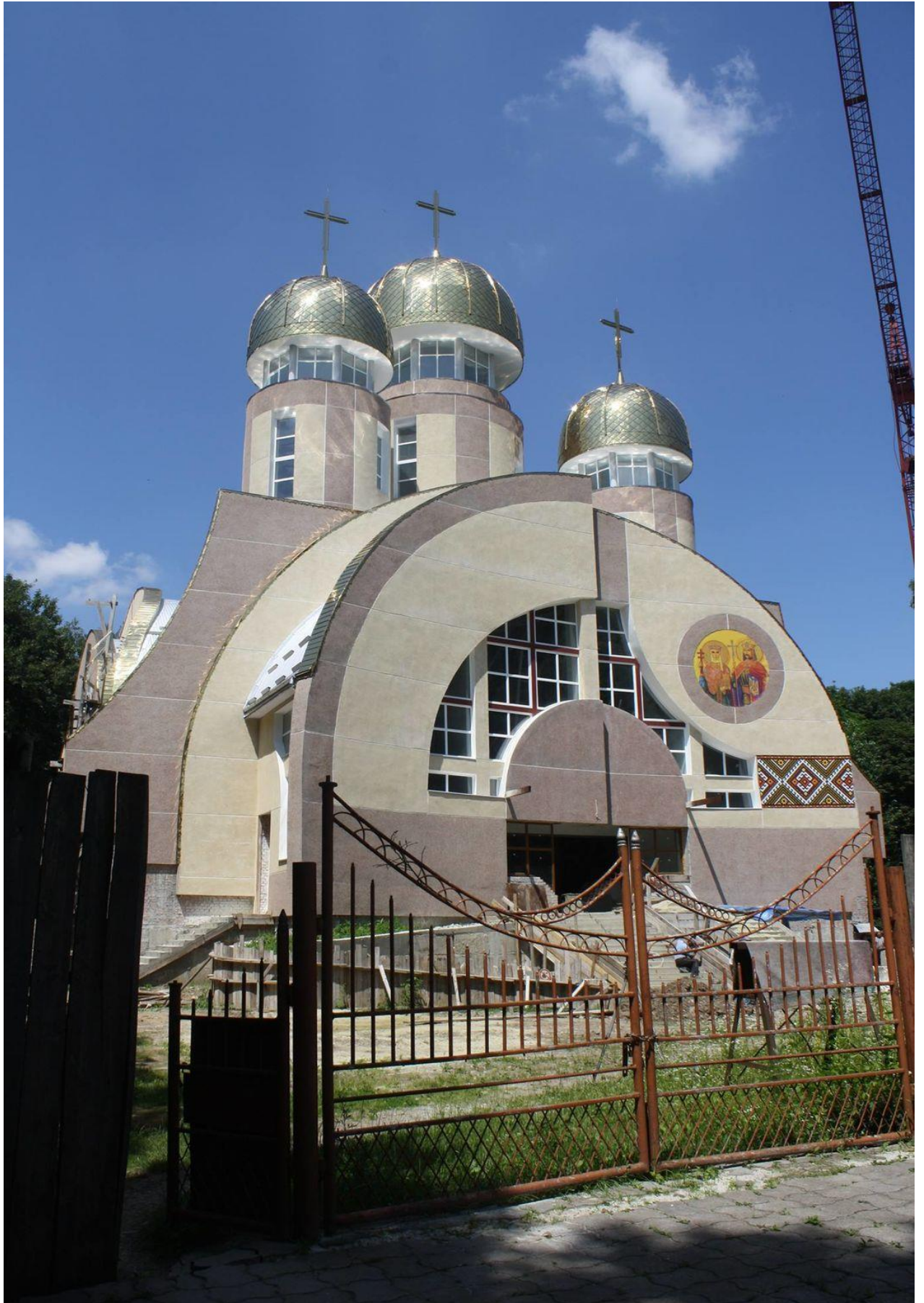
Кам'яний храм свв. Володимира і Ольги (сучасний вигляд)