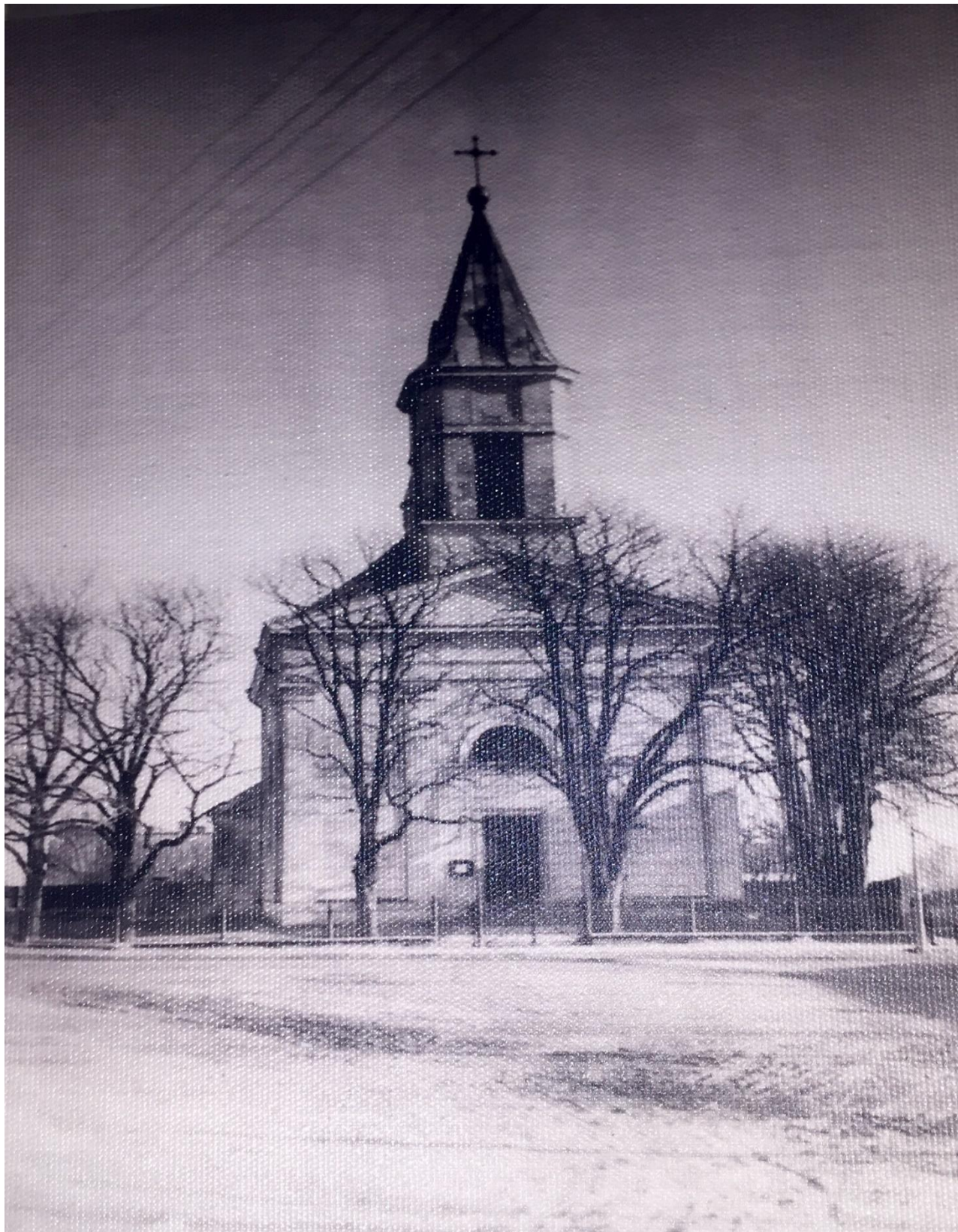
Однонавовий костел з вежею-дзвіницею м. Стрий 1930 р. (в сучасності катедральний храм Успіння Пресвятої Богородиці)