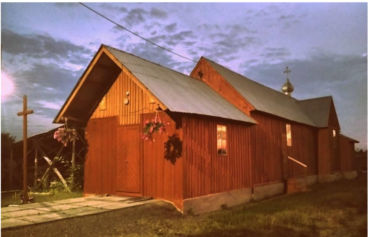
Дерев'яна каплиця Блаженного священномученика Миколая Чарнецького (перевезена з с. Колодниця Стрийського району)