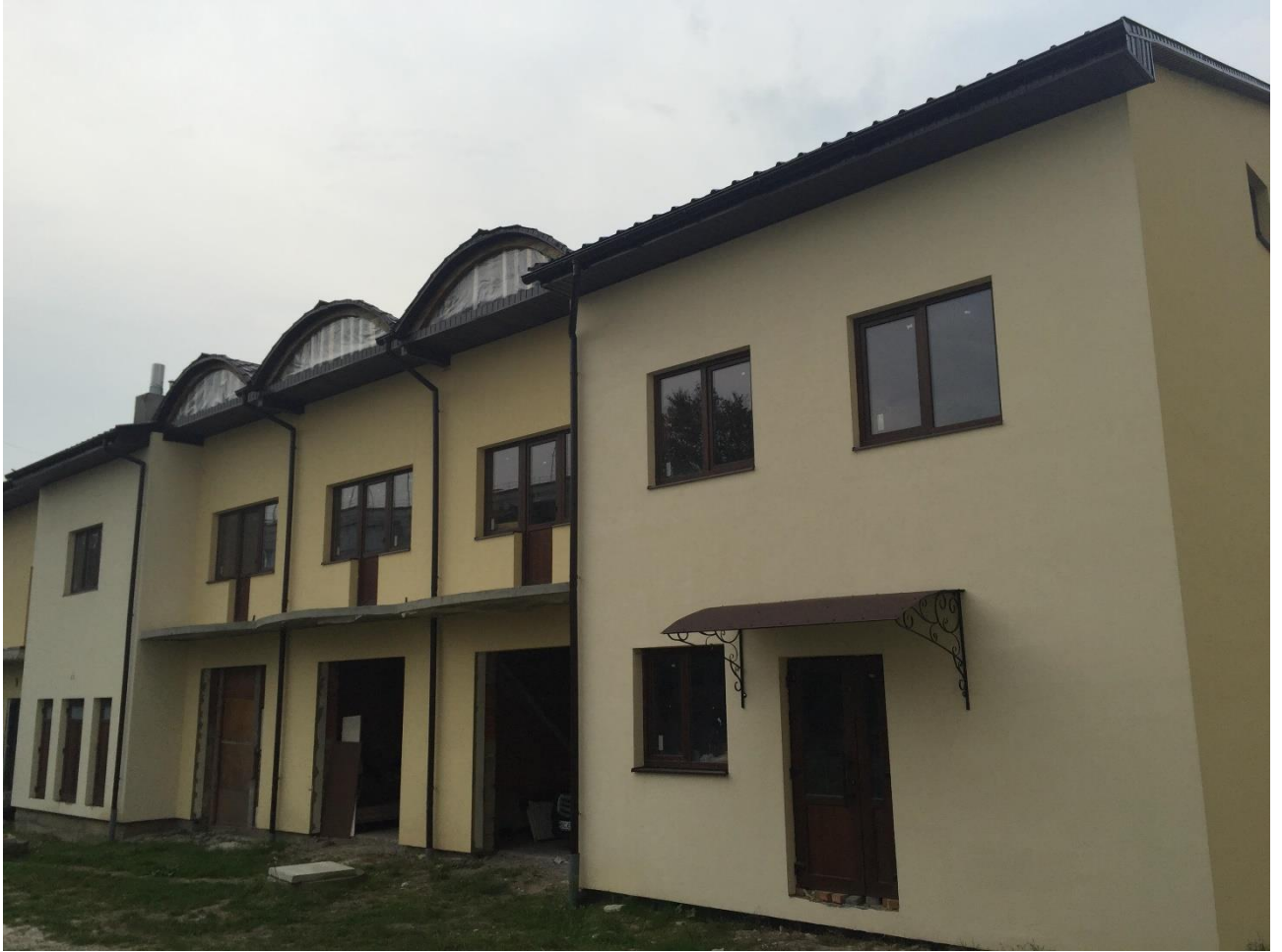
Будинок для потребуєчих парафії Всіх Святих Українського Народу