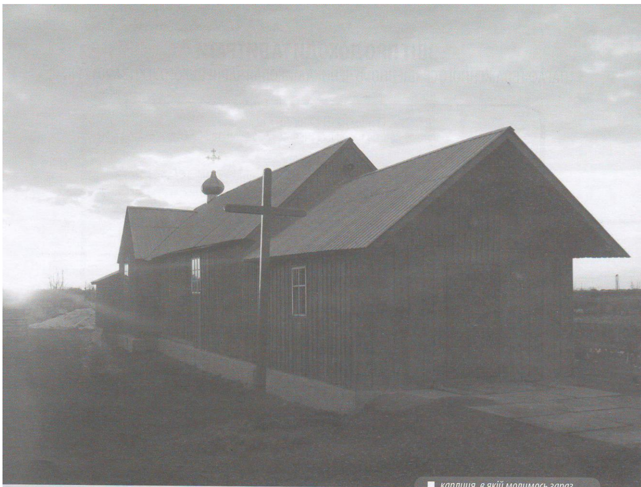
■ каплиця, в якій молимося зараз

Збір коштів ще досі триває. Зважаючи на можливості, маємо потребу до кінця лютого зібрати кошти хоча би на заготовлю брусів, оскільки якісне будівельне дерево вже закінчується у лісах, і постійно зростає в ціні, а також навесні і літом, через набирання соку, вже є для заготовки непридатним.