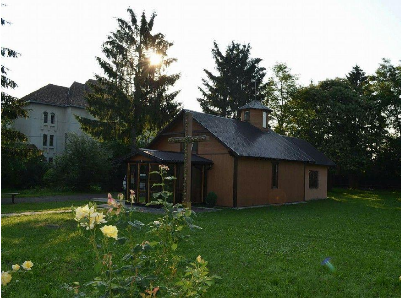
Дерев'яна каплиця Блаженного священномученика Йосафата Коциловського