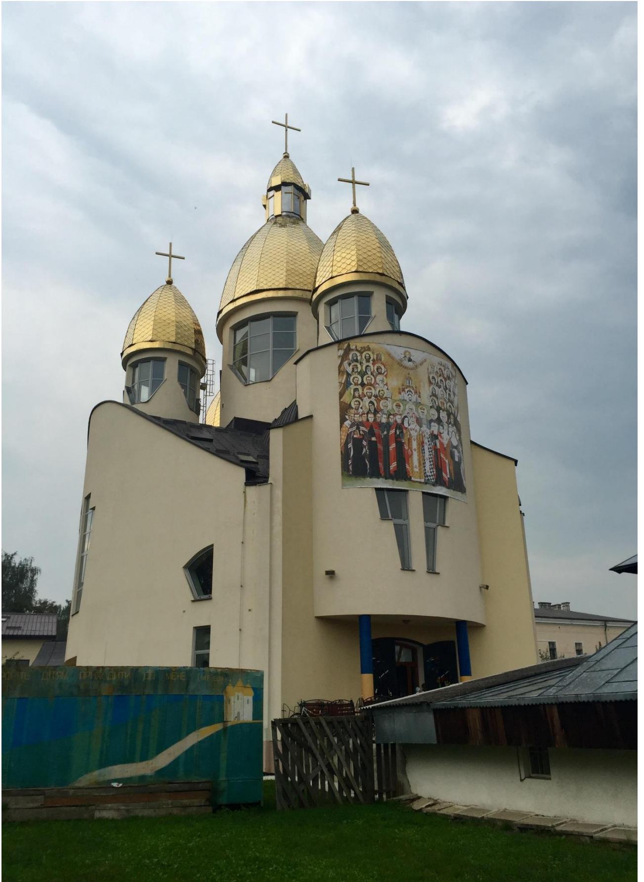
Кам'яний храм Всіх Святих Українського Народу