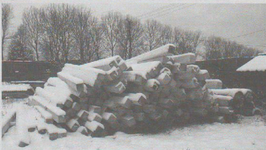
■ початок заготівлі брусів

2. Навести порядок з дозвільними документами і передати їх на експертизу. Підготовка дозвільної документації є теж необхідним елементом будівництва, яку, мабуть, непомітно зовні, але яка, попри фінансові