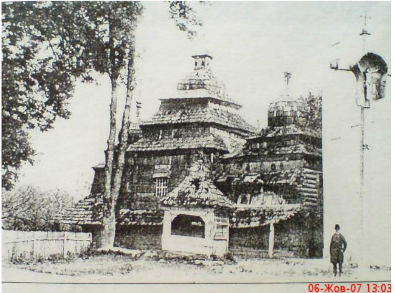
Дерев'яний храм Благовіщення Пресвятої Богородиці на «Ланах» (проіснував до 1891 р.)