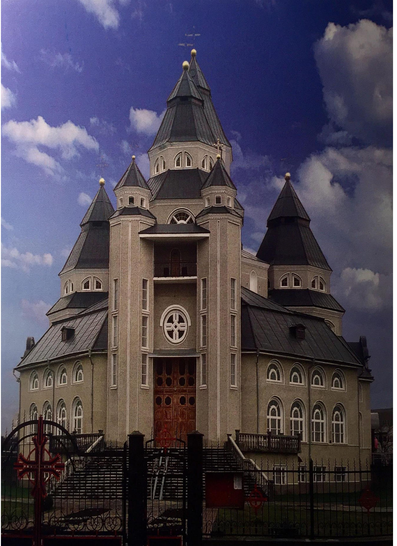
Кам'яний храм святих апостолів Петра і Павла (сучасний вигляд)