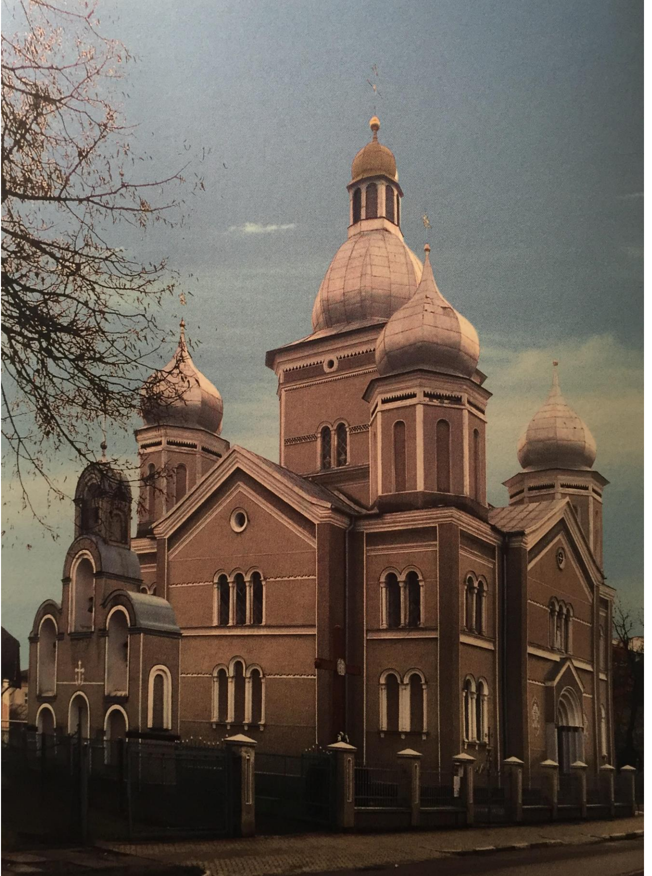
Мурований храм Благовіщення Пресвятої Богородиці (сучасний вигляд)