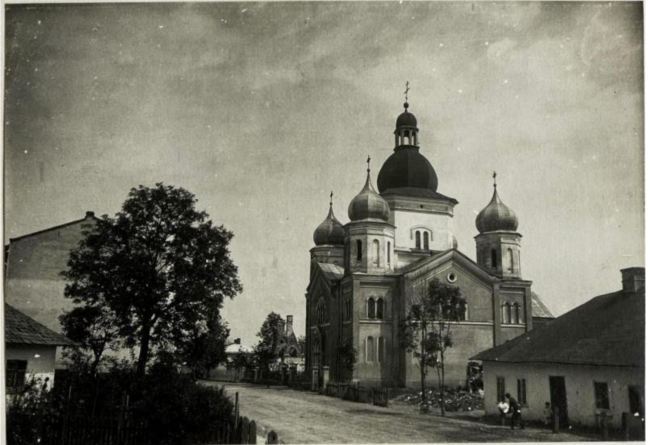
Мурований храм Благовіщення Пресвятої Богородиці (1887 р.)