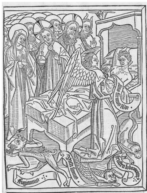
Ілюстрація 2: Ангел зміцнює віру помираючого, ліжко якого оточують Свята Трійця, Матір Божа й святі, під ногами — переможені чорти. Сторінка з «Ars moriendi», надрукованої ксилографічним способом в Південній Німеччині близько 1480–1485 рр.